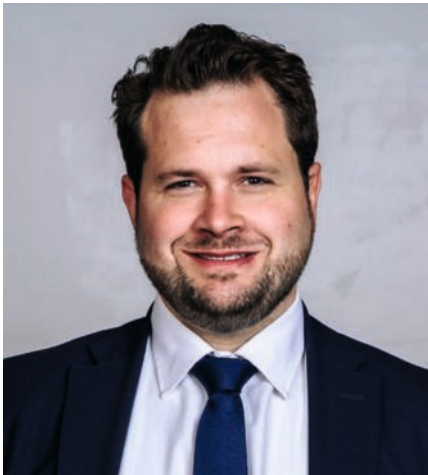
Af Anders Vistisen, medlem af Europa-Parlamentet for Dansk Folkeparti

Den nye EU-Kommission er nu blevet præsenteret og det står allerede klart, at vi kommer til at se endnu en acceleration af EU's føderalistiske projekt.